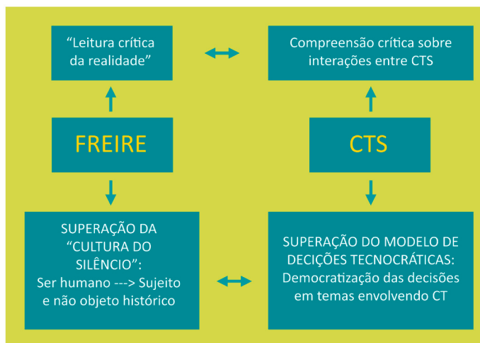
Esquema 2: Aproximação freire-cts