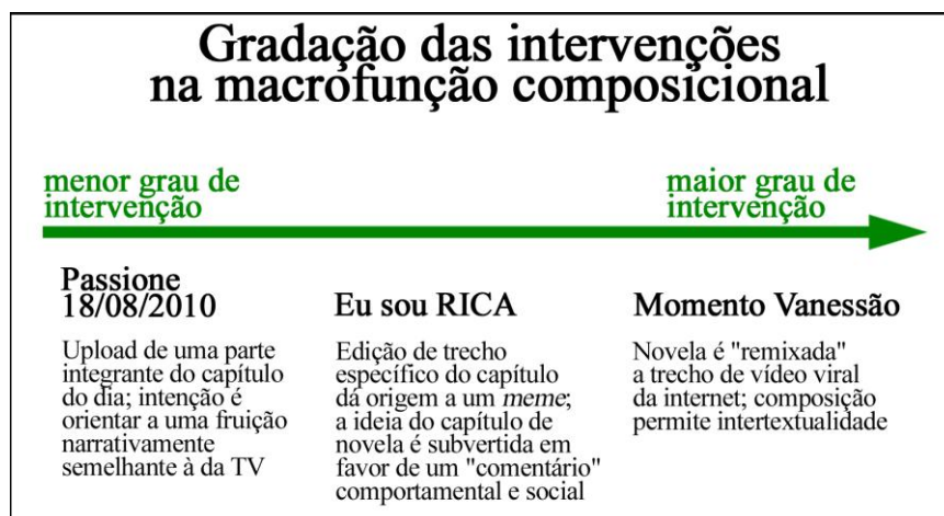
Figura 2: Graus de intervenção em termos composicionais no item vídeo

Nesse processo, os modos visual e sonoro dos vídeos em questão passam por processo de edição. O que se vê na lexia , porém, é o resultado dessa manipulação, iniciada já no processo de upload dos vídeos. Ao nos determos sobre os atributos composicionais do item vídeo, é possível discernir diferentes graus de ativismo com que os usuários interveem nas produções audiovisuais. Diante de tais intervenções, é possível estabelecer um fluxo, conforme apresentado na Figura 2 a seguir.