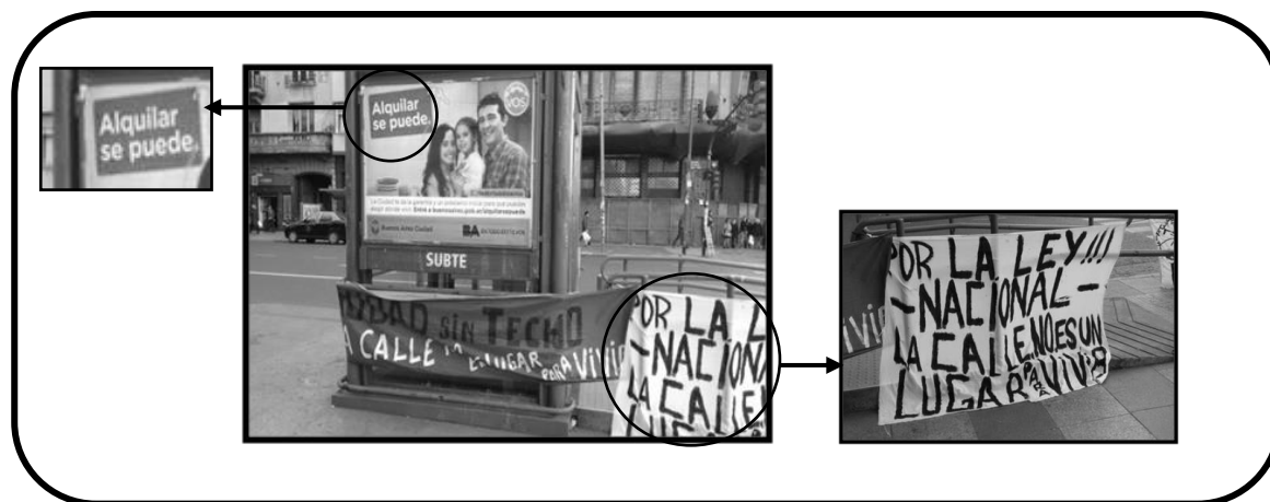
Figura 1. Reclamo bajo el lema ‘La calle no es un lugar para vivir’.

Paralelamente, si bien Cantor (2012) sostiene que la emergencia habitacional fue ratificada por el Poder Ejecutivo a través de decretos; en términos jurídicos, esta se encuentra vetada 4 . Por ello, también, quienes no lograron acceder al derecho a la vivienda digna requirieron, en varias oportunidades, una nueva declaración de la emergencia habitacional para que se priorizaran las políticas públicas en dicha materia. Estas expresiones cobran aún más valor si se sigue el concepto de Necesidades Básicas Insatisfechas (NBI) provisto por el Instituto Nacional de Estadística y Censos (INDEC), dado que el padecimiento de problemáticas habitacionales graves es comprendido como un indicador o señalador de pobreza. Esto quiere decir que quienes habitan en inquilinatos, hoteles, pensiones, viviendas no destinadas a fines habitacionales, viviendas precarias y quienes habitan en situación de calle son personas cuyas necesidades básicas no están cubiertas y, dicho en los propios términos de la entidad, ...los grupos humanos con NBI constituyen sujetos prioritarios de políticas públicas tanto sociales como económicas (INDEC, 2012, p. 309).