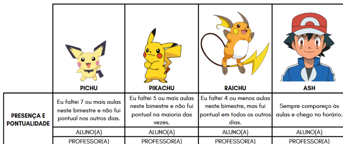
Figura 3 - Critério ‘Presença e Pontualidade’ e seus níveis de desempenho