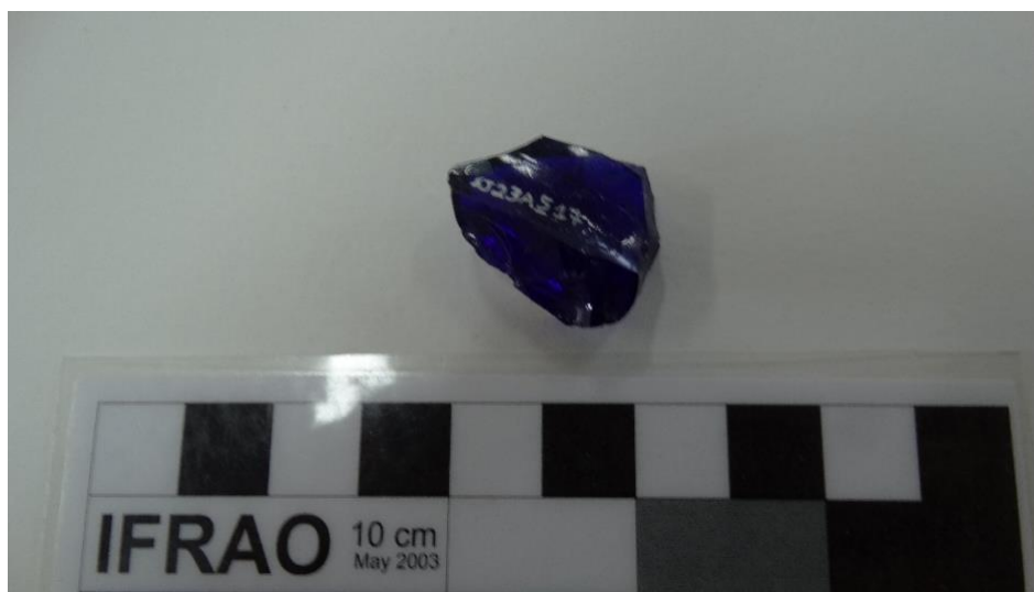
Figura 3. Pingente azul manufaturado em vidro.

Por fim, para o Pai-de-Santo Cléber Vieira, a possibilidade de vinculação vem dada pelo próprio contexto da escravidão: “acredito que eles não iam usar um vidro para determinado orixá, mas se ele fosse fazer um fio tinha que ter alguma coisa da cor desse orixá [Odé]” ( apud MEZA, 2021, p. 56).