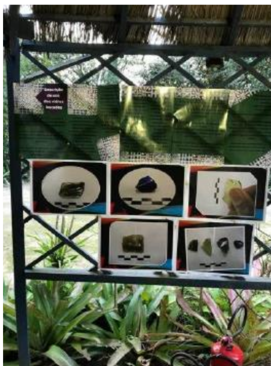
Figura 4. Painel sobre os vidros na segunda Exposição na Charqueada São João.

Na segunda exposição que realizamos, no dia 13 de maio de 2018 (Dia dos Pretos Velhos na Umbanda), o conteúdo expositivo incorporou as interpretações dos interlocutores e interlocutoras praticantes do Batuque, de forma que outras perspectivas sobre os vidros, além das puramente arqueológicas, pudessem ser transmitidas ao público (MEZA, 2021). Além dos diálogos estabelecidos em torno aos vidros arqueológicos, outros painéis abordaram um assentamento para os Orixás Bará e Ogum composto por um aglomerado de ferro que se encontrava embaixo da estrutura da senzala na Charqueada São João, cachimbos, uma possível quartinha e um conjunto de ossos de animais, também da área da senzala. Esta exposição esteve integrada ao roteiro do espetáculo “Dança dos Orixás” da Companhia de Dança Afro Daniel Amaro (MEZA, 2021).