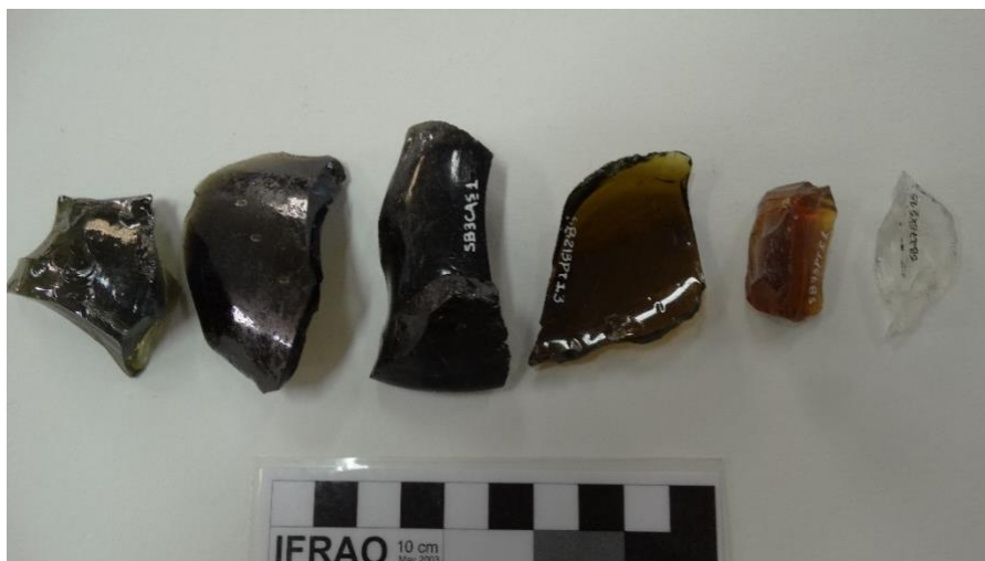
Figura 1. Vidros lascados da Charqueada São João.