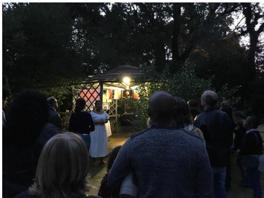
Figura 5. Convite da narradora da “Dança dos Orixás” para o público conhecer a segunda exposição.