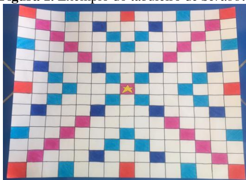
Figura 1. Exemplo do tabuleiro de Scrabble