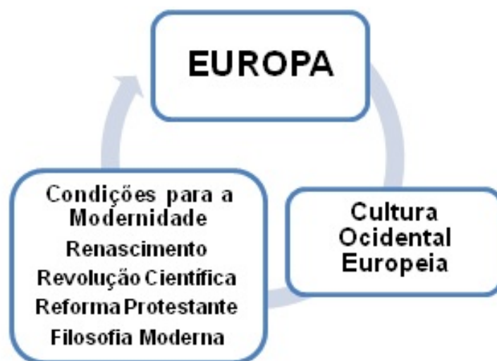
Figura 01- Paradigma Eurocêntrico

O Paradigma eurocêntrico, então, se configura por períodos históricos, entre os quais o Renascimento, o Iluminismo, a Reforma Protestante, que consolidaram o pensamento moderno tendo como centro geográfico e cultural a Europa, conforme figura 1, a seguir.