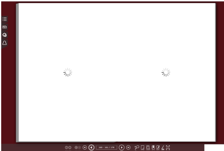
Figura 2 – Printscreen de tela mostrando o carregamento da página em livro digital acadêmico Elaboração da autora.

A apropriação do texto, sua difusão, os direitos autorais, o controle de suas cópias, sua visibilidade, seus modos de acesso tornam-se questões relevantes para todos os atores sociais envolvidos no mundo da leitura e da escrita. As práticas do leitor são afetadas desde sua decisão de adquirir um livro em sua versão impressa ou digital até suas “sensações” ao lidar com determinados aspectos da leitura, tais como este, em um livro digital, de contornos completamente novos na história dos suportes de ler: