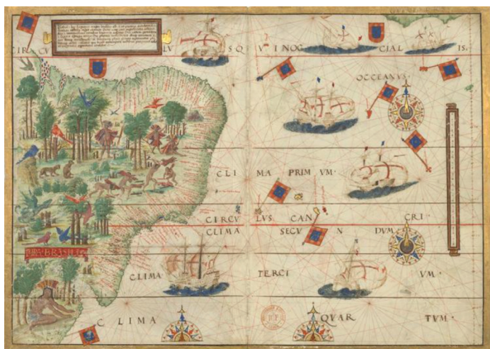
Figura 1: Mapa português do Atlântico meridional. Atlas Miller, Paris, Biblioteca Nacional.

Segundo Ainsa (1999), na descrição das duas terras – a maldita e a prometida – está a oposição do espaço real, onde se vive, e o espaço ideal, das crenças, ou seja, a própria dualidade antinômica fundante do mito, motivo dos êxodos e emigrações em busca da Terra Sagrada. Sobre essa idealização do espaço distante, elabora-se uma ideia de mundo novo, o Novo Mundo, uma terra prometida aos povos ou indivíduos mercedores do Paraíso.