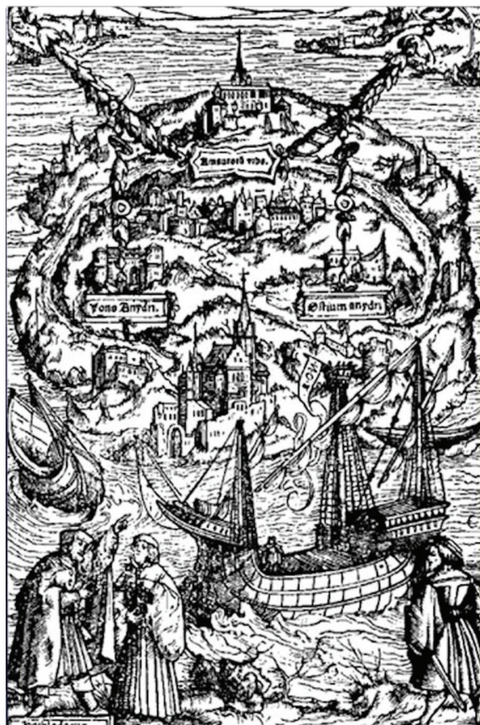
Figura 2: Xilogravura por Ambrosius Holbein de uma edição de 1518 de Utopia .

Nota-se aqui uma variação dos dois termos, que ora traduzem o seu tempo histórico, ora afirmam o tempo mítico. Enquanto a utopia representa um gênero literário, o discurso utópico representa um pensamento, ou um modo de imaginação. O uso mais recorrente é o pejorativo, de algo que é irrealizável, impossível de realizar, e se aproxima do utopismo, ou do discurso utópico. De qualquer modo, tanto a utopia quanto o discurso utópico têm uma natureza dual, tensionada entre a realidade e a ficção, situada entre o passado, o futuro e o presente.