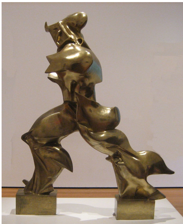
Figura 2: Umberto Boccioni: Formas Únicas de Continuidade no Espaço , 1913.

à velocidade e ao dinamismo, deformando-se no espaço-tempo representados pela matéria. Já na pintura Cão na Coleira (Figura 3), Giacomo Balla apresenta uma imagem psicológica do movimento, uma representação mental do próprio homem moderno, em que predominam a repetição e a simultaneidade das imagens, a quarta dimensão. Ambas as obras são extensões da percepção sobre o movimento vinculado às máquinas.