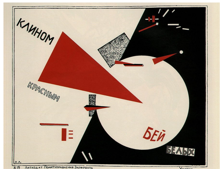
Figura 5: Com a cunha vermelha, golpee os brancos. El Lissitzky, 1919.

As expressões artísticas são construções (e não representações) à serviço do desenvolvimento da revolução. A arte será informativa, não mais representativa, à serviço da revolução e da instrução artística popular. Os cartazes de El Lissitzky (Figura 5) supõem eliminar qualquer contradição entre a operação estética e a tecnologia industrial. Para tanto, aplica o rigor formal a uma arte industrial que se denomina como a “verdadeira arte popular” (ARGAN, p.324-330). Resta identificar em que momento as expressões artísticas 1) expressaram a sua autonomia e 2) deixaram de atender às forças da revolução para serem reduzidas a instrumento de propaganda política: a arte-propaganda de Estado.