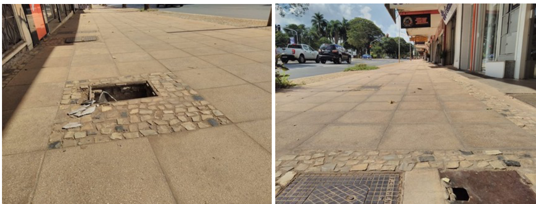
Figura 7 e 8. Calçadas já demonstrando desgastes e falta de manutenção, na 509 sul e 510 Sul, respectivamente.

Após poucos meses de inauguração da obra, a acessibilidade prometida já encontra sinais de desgastes, e ela, mesmo assim, não foi completada em sua plenitude: os pisos táteis não estão completamente postos, e quando estão, ligam os pontos de ônibus às faixas de pedestres e semáforos de travessia. Também já é recorrente a falta de algumas tampas de bueiros, caixas de esgoto e telefones públicos ao longo da via. Aparentemente, a manutenção não deve ser periódica.