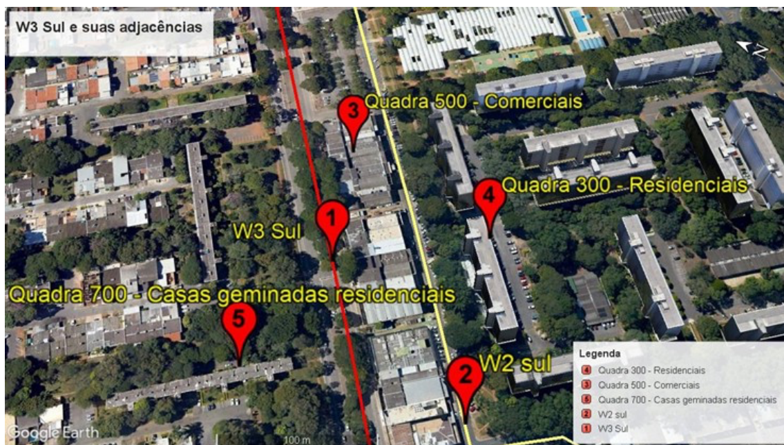
Figura 2. Reprodução atual a partir de recorte da W3 Sul e suas adjacências. Para entender a sua configuração territorial, deve-se entender a ocupação de Brasília: a primeira porção a ser habitada dentro do Plano Piloto da nova capital iniciou-se nas quadras 300, à direita da figura (4). A W3 Sul (1), identificada em seu centro, está entre as quadras 500 (3) (planeada para o pequeno comércio local) e as 700 (5) (para a pequena produção agrícola, mais tarde revertidas para o zoneamento residencial exclusivo). Os primeiros logradouros a receberem moradores eram os que ocupavam o interior da Asa Sul, sobretudo a 307 e 308 Sul.