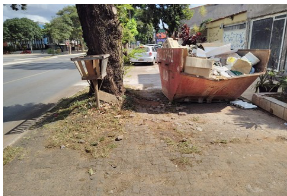
Figura 6. Calçada inexistente destruída pela ação do tempo na 706 sul, no lado destinado às residências. Pode não parecer, mas essa fotografia foi tirada rigorosamente na outra margem de onde foi tirada a Figura 5.