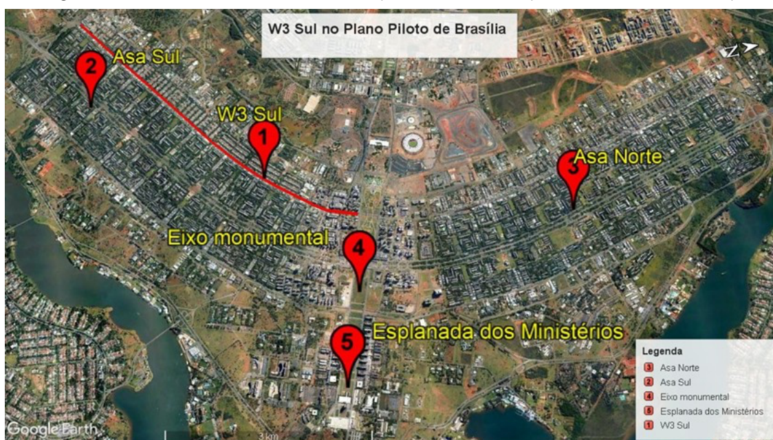
Figura 1. Recorte do Plano Piloto de Brasília. Em destaque, tracejada na cor vermelha, a Avenida W3 Sul. À direita está o Eixo Monumental, onde ela inicia-se, até sua extremidade sul, à

esquerda da imagem, na quadra 16 Sul. Na margem direita desta, estão as quadras 700 e na esquerda as quadras 500.