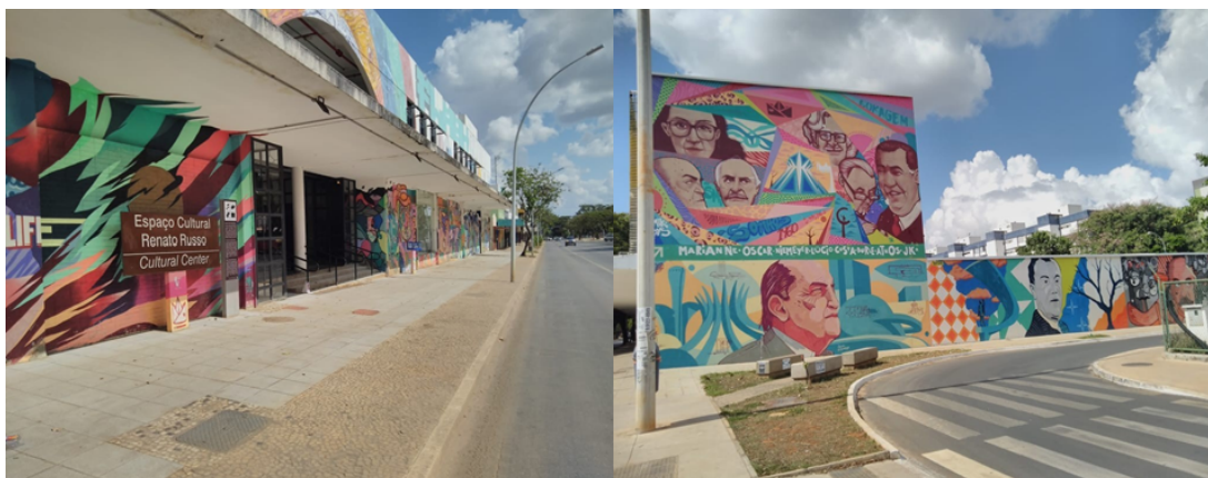
Figuras 9 e 10. Novos usos à W3 Sul: Espaço cultural Renato Russo, à esquerda, e painel de arte urbana, à direita, retratando os fundadores da cidade, em suas adjacências.