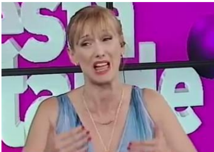
Imagen 4 Finalmente, cuando la entrevista gira hacia la vida

Profundización de la expresión de desagrado al hablar de la doma, los párpados continúan rígidos y las cejas se elevan y se arquean hacia afuera, en una combinación de desagrado y tristeza (negativas). Los labios siguen rígidos. Además, se suma un ilustrador con ambas manos y muy poco movimiento, que denota una entidad con la que se establece la relación emocional marcada por el rostro.