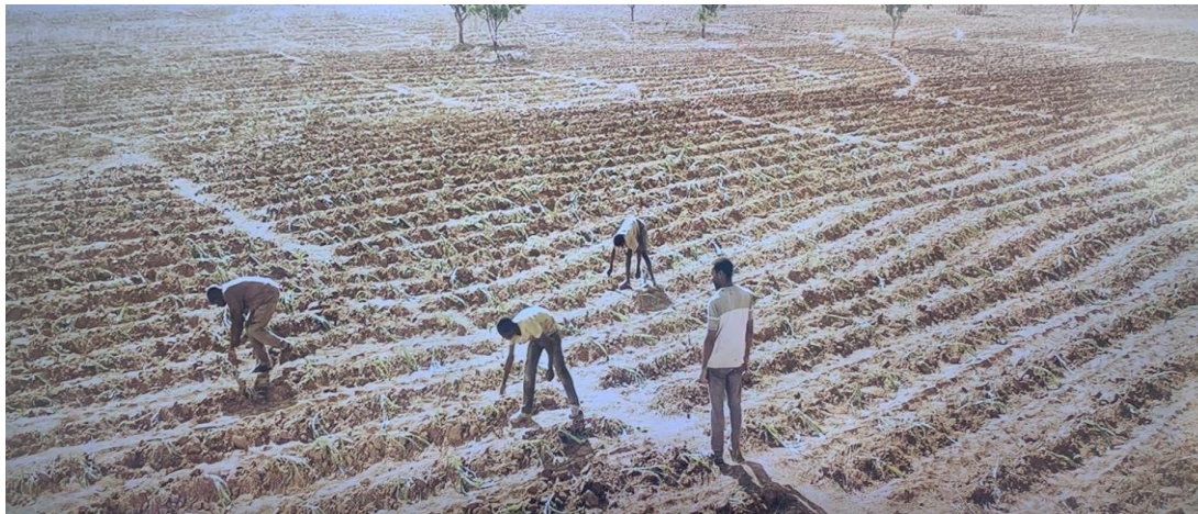
Figura 2: A seca no vilarejo

A imagem acima é carregada de simbolismo. Ao analisá-la sob as perspectivas da imagem e da memória, refletimos sobre a representação visual e a carga emocional que ela carrega. Aumont discute como as imagens são construídas e como elas comunicam significados. A imagem dos campos secos e rachados evoca uma realidade brutal: a seca e suas consequências devastadoras