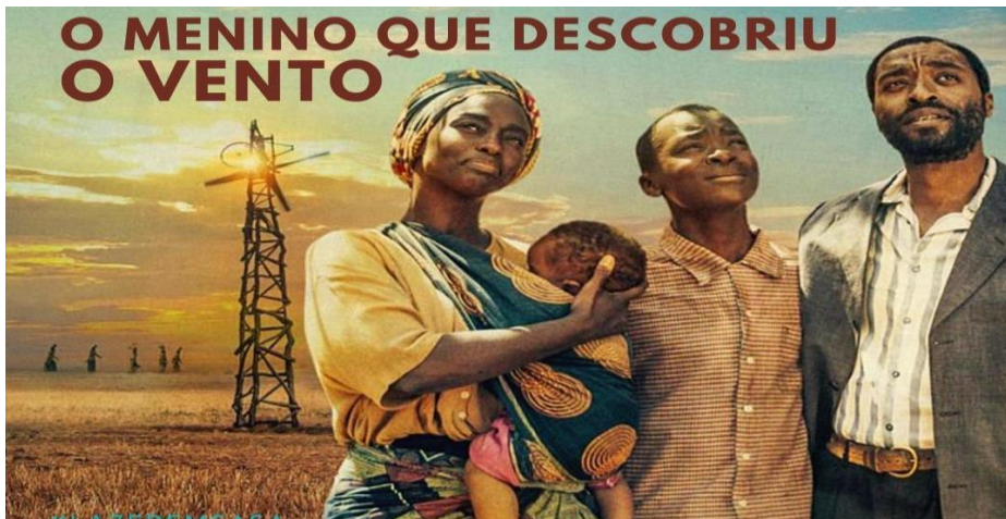
Figura 1: William e sua família

O Menino que Descobriu o Vento 1 é um filme de 2019 dirigido por Chiwetel Ejiofor, baseado no livro homônimo de William Kamkwamba e Bryan Mealer. O filme, produzido no Reino Unido e distribuído pela Netflix, tem uma duração de 113 minutos e conta com trilha sonora de Antônio Pinto e fotografia de Dick Pope. A trama se passa em uma pequena vila na República do Malawi, um país da África Oriental, e que possui o inglês como língua oficial, além de possuir outras línguas locais, onde William Kamkwamba, interpretado por Maxwell Simba, é um garoto curioso e apaixonado por ciências e invenções.