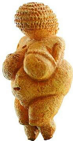
Figura 1 Vénus de Willendorf . 1

Escultura encontrada nas proximidades de Willendorf, na Áustria, em 1908. Encontra-se exposta, atualmente, no Museu de História Natural de Viena.