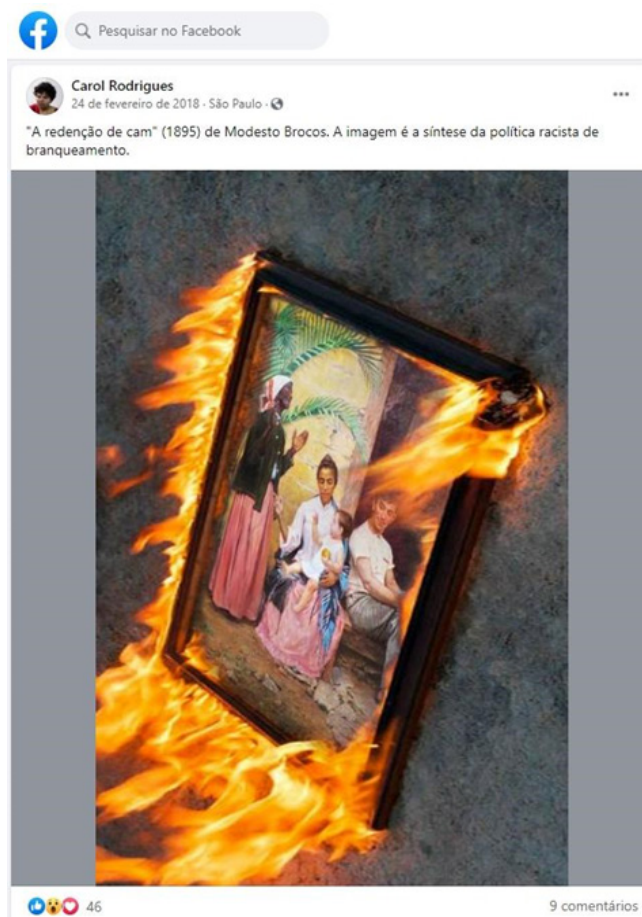
Figura 4 Publicação no Facebook (2018) 47

Em publicação no Facebook , no ano de 2018, um perfil alude a destruição da pintura de Modesto Brocos ao queimar uma reprodução da tela (Figura 4), considerada “a síntese da política racista de branqueamento” 48 , na argumentação do usuário. O que se pode refletir é como a recepção da pintura pode ser afetada a depender do contexto, sociedade ou espaço em que a obra circula. Nesse sentido, a recepção virtual de “A Redenção de Cam” (1895) deve ser encarada como um sintoma das movimentações sociais no contemporâneo, debates que englobam temas e disputas sobre o tempo passado, o racismo, a representatividade, o empoderamento, a iconoclastia como ferramenta de resistência, a polarização