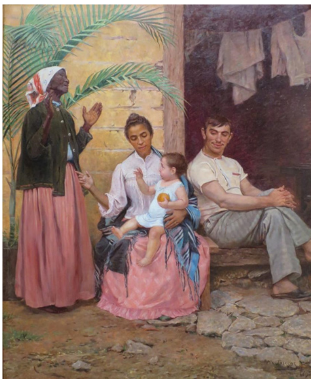
Figura 1 Pintura “A Redenção de Cam” (1895) 4

Inicialmente, o que se pode refletir é que a tela dialoga com contrastes. De cor, mas igualmente temáticos. Diferenças articuladas na idade, no gênero e no tom de pele das personagens, como também na combinação de elementos populares com os científicos. Mescla aspectos religiosos com os geneticistas, tendo em vista a apropriação da figura bíblica Cam em tempos da profusão de teorias raciais, como a eugenia. Aborda, na mesma medida, o tempo passado e o futuro de uma família que participa da chegada de um novo integrante – narrativa produzida na transição entre a política imperial e a republicana, especialmente com o fim da escravidão. Apesar do visível afeto na cena, o roteiro produzido por Modesto Brocos, pintor naturalizado brasileiro no mesmo período de produção do quadro, aponta para uma história de maldição, ou melhor, da reversão de um