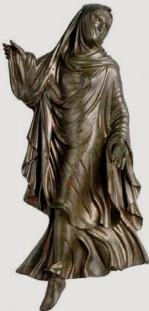
Figura 3 - "La danzatrice di Industria" ("Verhüllte Tänzerin").

Como exemplo deste repertório, podemos observar a figurinha ápula Milão A.997.01.363 (Fig. 4). A maior concentração destas terracotas se dá na Ásia Menor, nomeadamente em Esmirna e Troia, seguida da Beócia, Ática e Corinto (Martin 2019:226), sendo produzidas entre o último terço do século IV e meados do séc. I AEC.