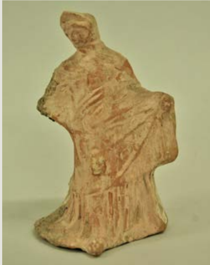
Figura 4 – Dançarina com véu

Figurinha de terracota ápula. c. 250-150 AEC. Milão, Civico Museo Archeologico, A.997.01.363. Sena Chiesa, 2004, cat. 360.