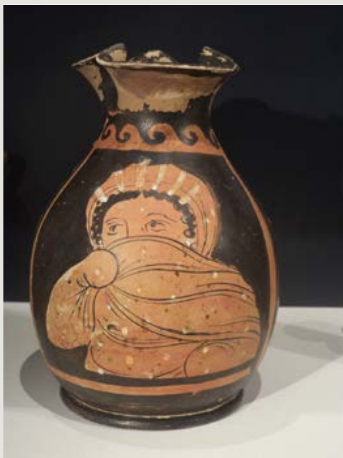
Figura 11 – Dançarina com véu representada do peito para cima.

A oinochoe Tarento 52555 (Fig. 11), datada de 460-450 AEC, retrata a dançarina vista do peito para cima, com o torso, os braços, a cabeça cobertos, e o rosto parcialmente escondido pelo manto. Assim, esta oinochoe nos dá um outro exemplo de dançarina com véu, em um contexto de performance que não podemos definir, uma vez que os marcadores de espaço não são representados. A abordagem do pintor deste vaso corrobora a popularidade da dança com véu na sociedade tarentina de meados do século IV, porque bastava representar sua figura apenas em parte, para ser reconhecível. Mas o que indica que ela é uma dançarina e que ela está dançando? O que a diferencia da mulher loira, vestida de modo semelhante, somente com os olhos descobertos, que nos olha por detrás de uma janela, como representado em no lécito sobrepintado Tarento 99195? 2 O pintor deste lécito representa somente o busto, sem deixar elementos suficientes para diferenciar de uma mulher comum, enquanto que o pintor da oinochoe que analisamos aqui, mesmo a representando do peito para cima, indica o movimento dos braços, cobertos pelo manto, de acordo com o tipo padrão das dançarinas com véu registradas na pintura de vasos e nas estatuetas de terracota.