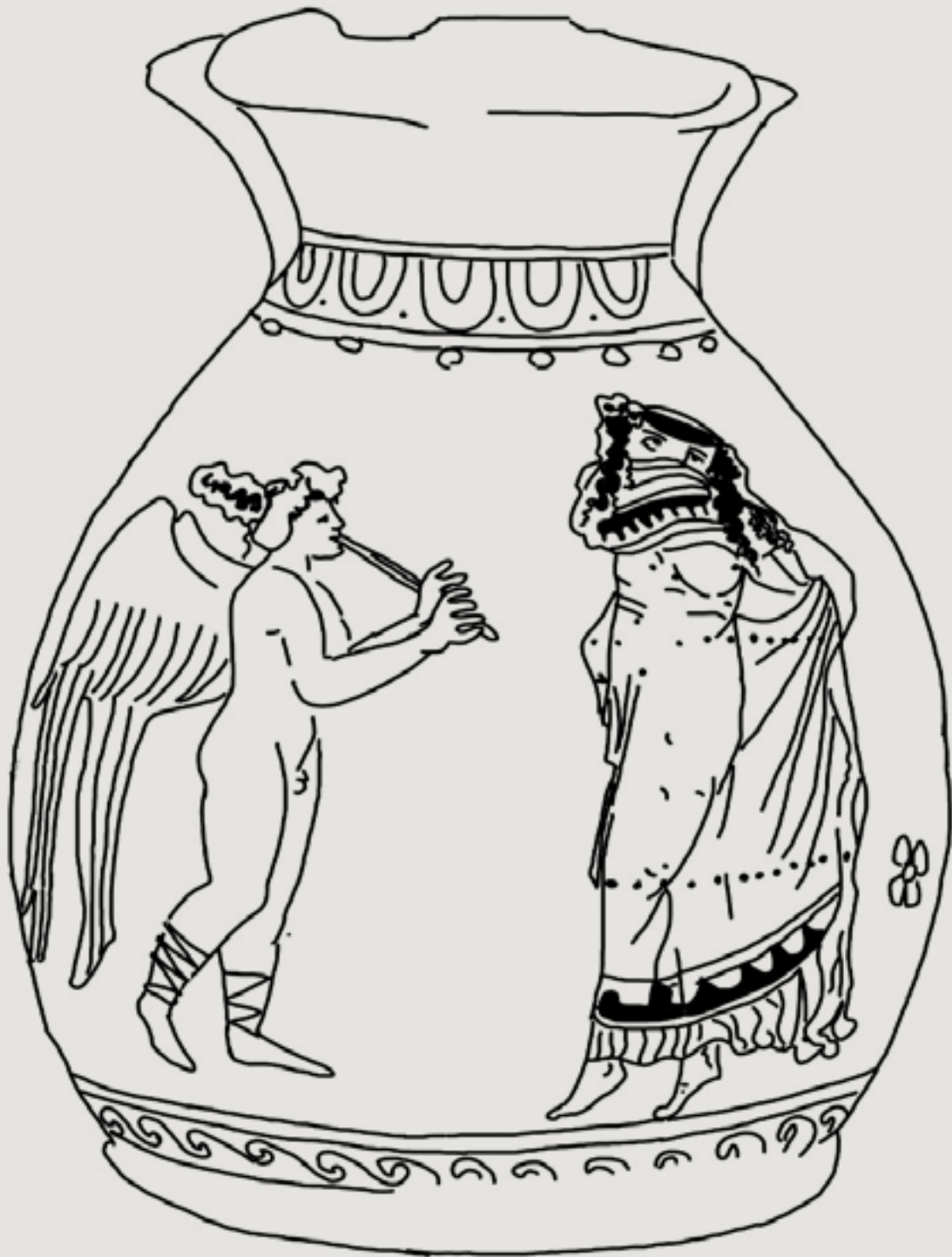
Figura 9 – Dançarina com véu vestindo manto transparente e Eros soprando aulos. Oinochoe ápula de figuras vermelhas. The Felton Painter (Trendall RVAp II Suppl. 40/81c). c. 380-360 AEC. Liège, coleção privada (coleção Derwain). Schauenburg 2001, fig. 8. Desenho: Lidiane Carderaro (2022).

O terceiro exemplo é um lécito ápulo de figuras vermelhas, de uma coleção privada alemã, publicado por Konrad Schauenburg, datado de 340-330 a.C., em que vemos uma cena mais complexa, com seis figuras, sendo um Eros, dois homens e três mulheres (Fig. 10).