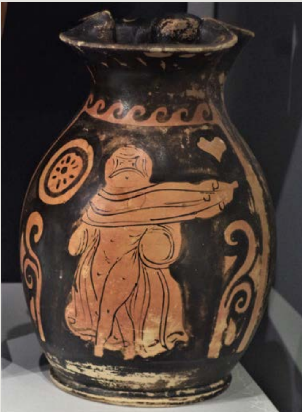
Figura 8 – Dançarina com véu com vestindo manto transparente Oinochoe ápula de figuras vermelhas. Encontrada em 1921 em Contrada Vaccarella, em Tarento. c. 350-325 AEC. Taranto, Museo Archeologico Nazionale, 20406.

O segundo exemplo é uma chous ápula de figuras vermelhas atribuída ao Pintor de Felton, datada de c. 380-360 AEC, anteriormente na coleção Derwa em Lüttich, que representa uma dançarina, com uma túnica e manto transparentes, cobrindo sua cabeça e rosto, deixando expostos somente os seus olhos (Fig. 9). Acompanha a dançarina um Eros, que sopra o aulos . A presença de Eros como um músico que acompanhada a dançarina sugere que esta performance poderia ter um contexto ritualístico, relacionado à iniciação amorosa da nymphé (noiva), ritual em que a transparência erótica faria sentido.