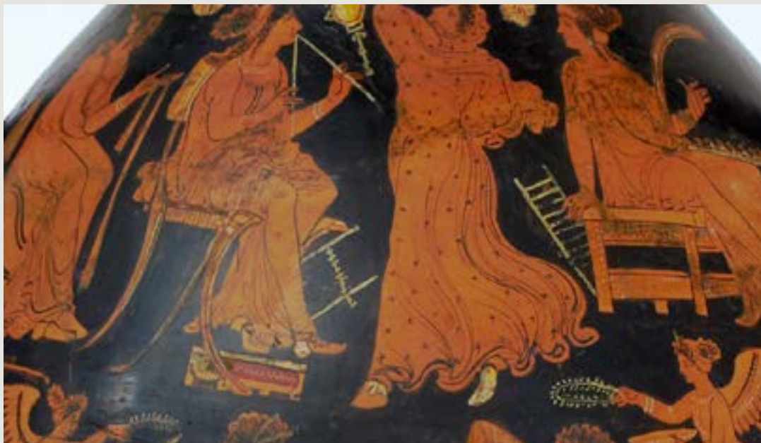
Figura 1 – Dança com véu em festa de casamento, acompanhada do aulos Pelike ápula de figuras vermelhas. The Painter of Copenhagen Dancer (RVAp 18/123). c. 340 - 320 AEC. Copenhagen, National Museum, Chr. VIII 316 (B154). CVA Copenhagen, National Museum 6, nº IV D, pr. 261 1a-c; 262.1.

o realizar o levantamento da iconografia dos instrumentos musicais na pintura dos vasos ápulos, produção de tradição grega do Sul da Itália, defrontei-me com um conjunto de imagens que despertou meu interesse, pois intuí possuírem um sentido bastante singular, e também revelador do sistema de sentido da imagética greco-indígena do Sul da Itália, da assim conhecida Magna Grécia. O repertório iconográfico ápulo do século IV a.C. revela uma série muito interessante, apesar de contida em um número reduzido de vasos. Trata-se das cenas de dança com véu (veiled dance, danza ammantata, Manteltanz, danse voilée), como podemos ver em destaque em uma pelike conservado em Copenhague (Fig. 1).