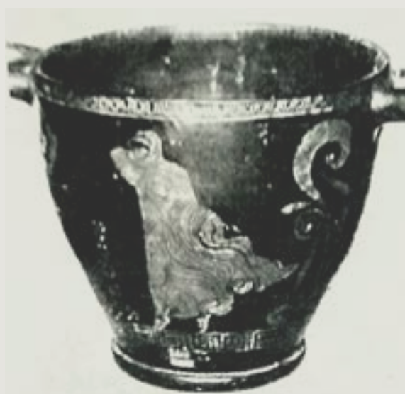
Figura 12 – Dança com véu (lado A) e Dioniso (lado B).

Nota-se a elevada estima que tinham por esta dança pelo gosto de explorar os seus detalhes e de representá-la em destaque. O pequeno skyphos Nápoles H 2303, encontrado em Armento na Lucânia ocidental ( Fig. 12 ), mostra de um lado Dioniso sentado e de outro uma figura feminina dançando na ponta dos pés, quase completamente coberta com o manto, que deixa visíveis somente olhos, nariz e parte dos cabelos. Ela faz um giro intenso, como indica o movimento esvoaçante de seu manto. H. Heydemann, pela associação com Dioniso no outro lado do vaso, vê na dançarina uma mênade. Não sou tentado a acolher esta interpretação, pois a meu ver a dançarina com véu não se insere no repertório das danças praticadas por mênades ou bacantes no contexto ápulo-tarentino. A relação aqui com Dioniso está na conexão entre este e Afrodite nas crenças funerárias da região. Porém, em sendo um vaso de pequenas proporções, o pintor optou por realçar, como único elemento representado, a figura da dançarina, sequer evidenciando o acompanhamento musical.