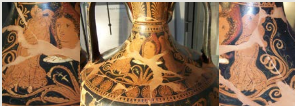
Figura 7 – Par de dançarinas com véu flanqueando cabeça de Adônis Ânfora ápula de figuras vermelhas. The Darius Painter (RVAp II 18/497-498). c. 330 AEC. Nápoles, Museo Archeologico Nazionale, inv. 81952 (H 3220). Giacobello 2020, 163-166, cat. 66.

brancas e vestindo manto longo que cobre a cabeça e deixa livres somente olhos e nariz, com os braços escondidos sobre o manto, repetindo movimentos já verificados nos exemplos anteriores. A ligação com Adônis coloca de novo a dança no campo de Afrodite e da significação amorosa. O fato de o pintor representar duas dançarinas não necessariamente descaracteriza o fato de ser uma dança solo, pois pode ter sido uma opção para o equilíbrio da distribuição das figuras na cena do colo do vaso (Heydemann 1879:5-6, A).