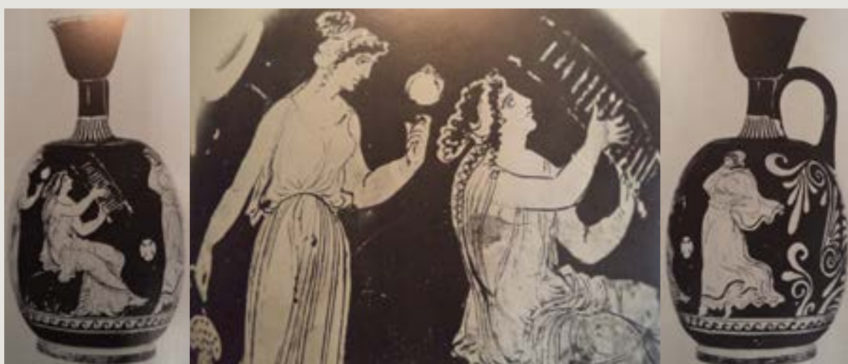
Figura 5- Dança com véu acompanhada do "sistro ápulo".

apenas os olhos e parte do nariz. Ela usa um manto liso, ornamentado apenas por uma faixa preta na bainha, que se pode observar nas extremidades e na parte que cobre a cabeça. A terceira figura feminina, de pé, à esquerda, atrás da musicista, vestindo um chiton pregueado e acinturado, ganha importância para se compreender a significação da performance coreográfica: ela tem nas mãos um espelho e um cacho de uvas, objetos que vinculam a cena ao campo de significação respectivamente de Afrodite e de Dioniso, associação muito recorrente no imaginário ápulo-tarentino. Mesmo que o pintor destaque as personagens e a performance musical-coreográfica, ele não se omitiu de nos indicar os marcadores de espaço: encontram-se em um terreno acidentado, montanhoso, cujas linhas e plantas outrora pintadas com cores vivas são apenas parcialmente visíveis hoje (Froning 1982:215). Além do motivo floral, uma rosácea e algumas gramíneas ao chão, o pintor apresenta, com linhas brancas, formações monticulares, rochosas (?), de diferentes tamanhos.