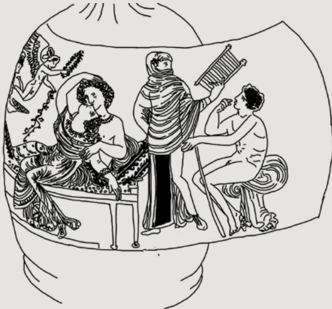
Figura 10 - Mulher de pé com véu e sistro ápulo. Lekythos ápulo de figuras vermelhas. c. 340-330 AEC. Coleção privada alemã II, no. 45 (Schauenburg 2001, 77, fig. 1-5). Desenho: Lidiane Carderaro (2022).

Os personagens principais podem ser identificados como o casal acomodado sobre a kline (à esquerda), que se abraçam e se beijam, os quais podemos identificar como a noiva e o noivo. Mais à esquerda, uma mulher com tympanon e phiale , e, em frente e pouco acima dela, um pequenos Eros voando para coroar a cabeça do noivo. À direita, uma mulher de pé e um jovem sentado. Ocorre aí uma conversa. O garoto está nu, sentado sobre seu manto. Ela segura um instrumento musical, o sistro ápulo (alternativamente nomeado pelos autores modernos como sistro retangular, xilofone ou psithyra ). Pelo modo como ela está se vestindo, foi caracterizada como uma dançarina com véu, mesmo que não esteja representada dançando, no momento retratado pelo pintor. O sistro ápulo é consistente com a performance da dança com véu, como vimos no lécito de Essen, apesar de que este instrumento tenha também um simbolismo associado à Afrodite. A túnica que esta mulher de pé usa é transparente, assim como o khiton da noiva, que está sentada. Eu vejo aqui o pintor replicar o casal, em dois momentos diferentes, em uma mesma face de um vaso, o que não é incomum na pintura de vasos ápulos. Assim, representando dois momentos, o pintor indica que a performance da dança com véu por parte da noiva seria considerada algo preparatório para sua futura vida amorosa.