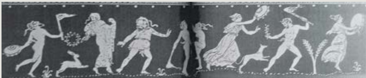
Figura 14 - Trupe (dançarina com véu, sátiros, mênades, ator phlyax e mulher nua dançando).

Askos ápulo de figuras vermelhas. Proveniente de Ruvo. Felton Painter. c. 375-370 AEC.