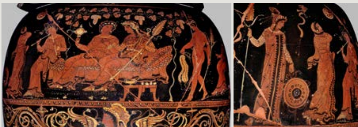
Figura 6 - Dança com véu acompanhada de aulos nas bodas de Dioniso e Ariadne Loutrophoros ápulo de figuras vermelhas. Achada em uma tumba da localidade S. Angelo, Ruvo, em 27 de maio de 1836. The Group of Ruvo 423 (RVAp 15/44) . c. 360-350 AEC. Nápoles, Museo Archeologico Nazionale, inv. 82265 (H 3242).

identificados (Giacobello 2020:137-138). O loutrophoros oval ápulo é um vaso que dispõe de espaço bastante amplo para receber cenas com narrativa iconográfica muito pormenorizada, diferentemente do espaço limitado que o lekythos disponibiliza ao pintor. Deste modo, o nosso loutrophoros recebe decoração figurada em três níveis: no colo e nas faixas superior e inferior da pança. Nos dois lados do colo do vaso, estão representadas cabeças de mulheres, em meio a motivos vegetais e florais, que remetem aos jardins fantásticos associados ao espaço imaginário de Afrodite protetora dos amantes e dos amores no além-túmulo. Na face anterior do vaso, o Anodos de Afrodite, com sua cabeça emergindo do botão de uma flor, indica a crença nos auspícios da deusa com relação ao além-túmulo. Essa proteção está bem atrelada às cenas representadas nas faixas superiores da pança, nos dois lados do vaso. Na face anterior, que não representamos aqui, abaixo da cabeça de Afrodite, em um ambiente do palácio de Menelau em Esparta, o pintor representa o enamoramento entre Helena e Páris, estando o ambiente amoroso de sedução associado à música da harpa e à oferenda à deusa Afrodite feita por meio da queima de incenso no thymiaterion (incensário).