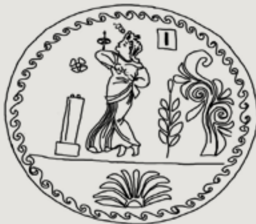
Figura 15 – Dançarina com véu diante de altar

vamos nos ocupar aqui apenas do prato n. 198 da coleção. É o único exemplar da pintura de vasos ápulos que vincula a dança a um espaço sagrado, de realização de culto, visto que a dança ocorre em frente a um pilar com funcionalidade de altar, sobre o qual foram depositados dois pequenos objetos como sacrifício (ovos?).