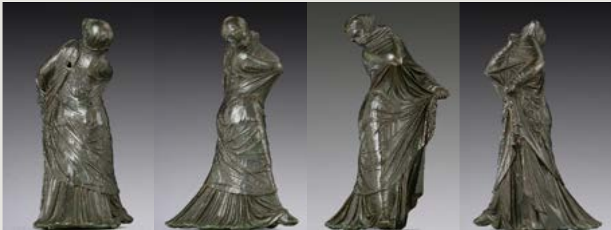
Figura 2 - "Baker Dancer".

Estatueta de bronze de uma dançarina com véu e máscara. Supostamente de Alexandria. Séc. III-II AEC. Nova Iorque, Metropolitan, inv. 1972.118.95.