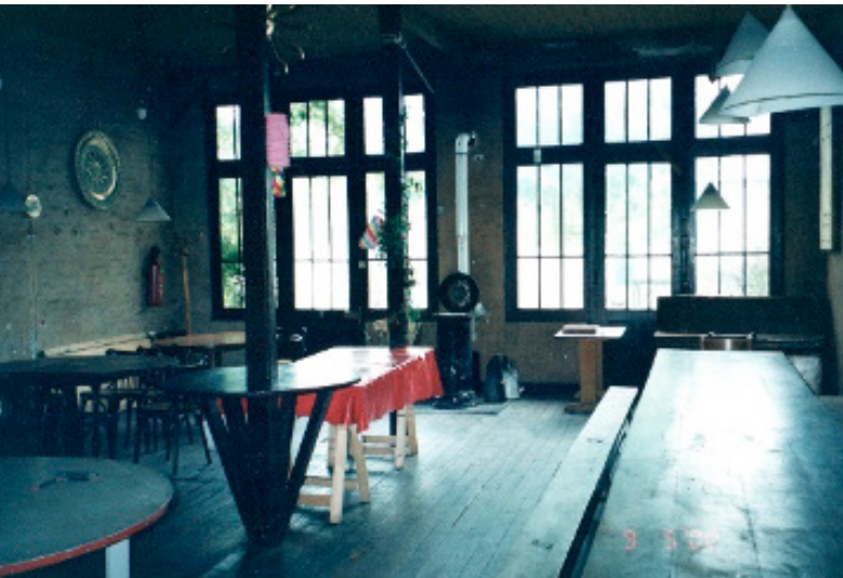
Figura 7: A sala de refeições da equipe do Soleil .

que serve de refeitório quando poucas pessoas vão comer lá. Num anexo à cozinha, está um refeitório agradabilíssimo. O cheiro e a sensação são de que chegamos numa casa muito acolhedora do interior do Brasil. Quando a companhia inteira está ensaiando, é lá que as refeições são servidas. Tudo é MUITO limpo.