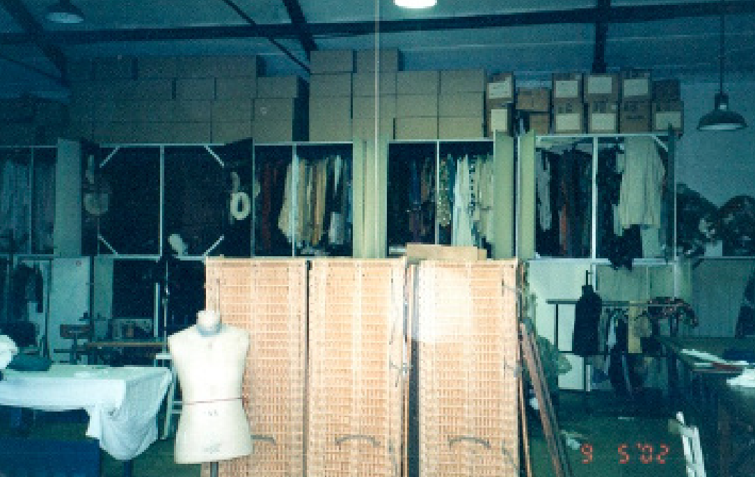
Figura 20: Os armários que guardavam, em 2002, as produções antigas do Soleil.