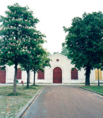
Figura 5: Os barracões do Soleil ao fundo.

Entrando no parque, na frente do teatro estão, à esquerda, seis vagões de trem que vieram da Holanda, com o objetivo de servirem de moradia para Ariane, Juliana e os dois filhos dela. Elas moraram por um grande período num quarto dentro do teatro, mas mudaram depois que cansaram de tanta mistura da vida pessoal com a vida da companhia. Atualmente, com as duas morando mais para lá do Soleil , os vagões são ocupados por pessoas que precisam de apoio – técnicos sem moradia, exilados políticos, enfim, pessoas que estão ligadas ao Soleil de alguma forma.