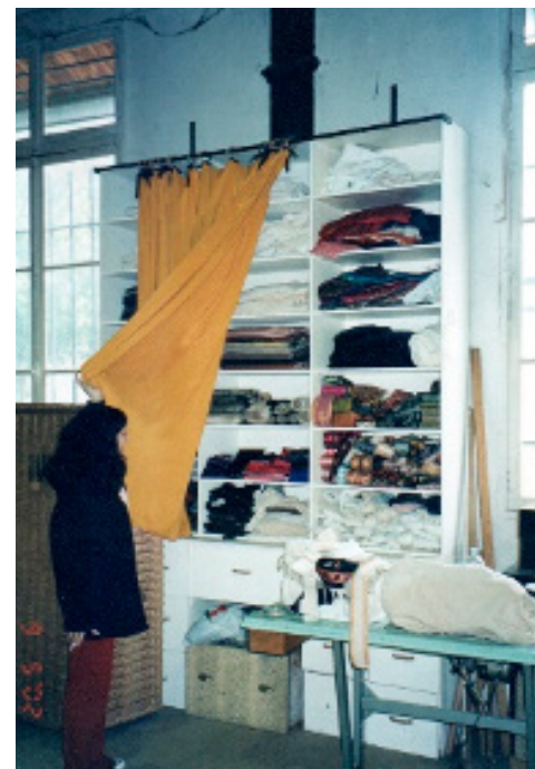
Figura 19: O armário em que ficavam, em 2002, os tecidos caros.

Do outro lado da sala estão os armários que guardam os figurinos de produções anteriores do Théâtre du Soleil . São armários altos, com trajes divididos mais ou menos por espetáculo. E tive acesso àquilo tudo, pude mexer, ver, tocar, perguntar sobre tudo... Os figurinos do ciclo de Shakespeare, golas oito como nunca vi tão bem executadas. Sapatos e acessórios também estão acomodados aqui. O corte das camisas é impecável.