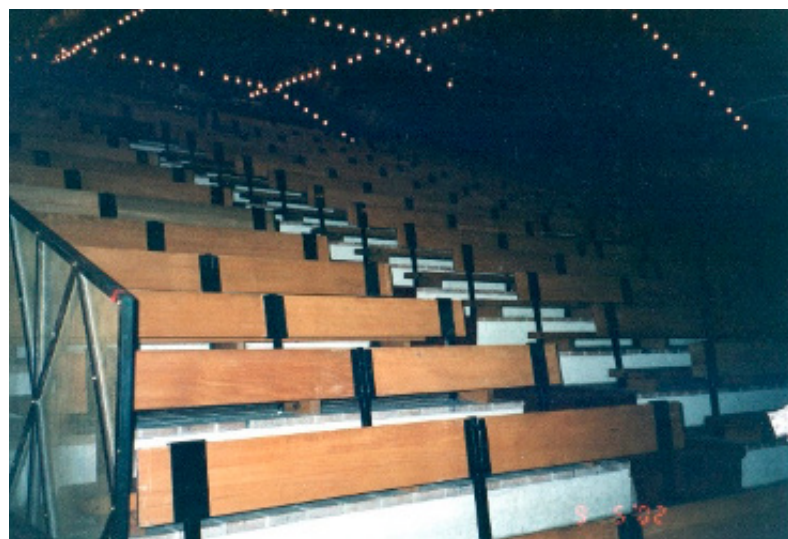
Figura 12: A plateia.

E andamos. A plateia, construída para L'Indiade , não é de madeira – é de concreto, fixa, gigante, para 600 pessoas. Não tem mais as almofadas que foram feitas para ela, mas está lá.