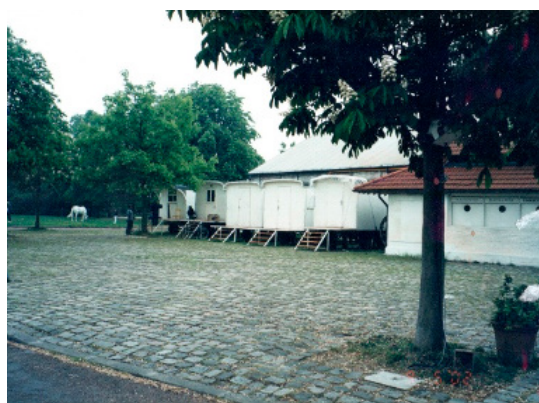
Figura 6: Os vagões de trem.

Na lateral do teatro, existe uma pequena lojinha onde se pode comprar material sobre o Soleil , aberta só nas temporadas. No segundo andar fica o escritório da administração, onde encontrei com Christophe Floderer – meu facilitador nesta viagem à França.