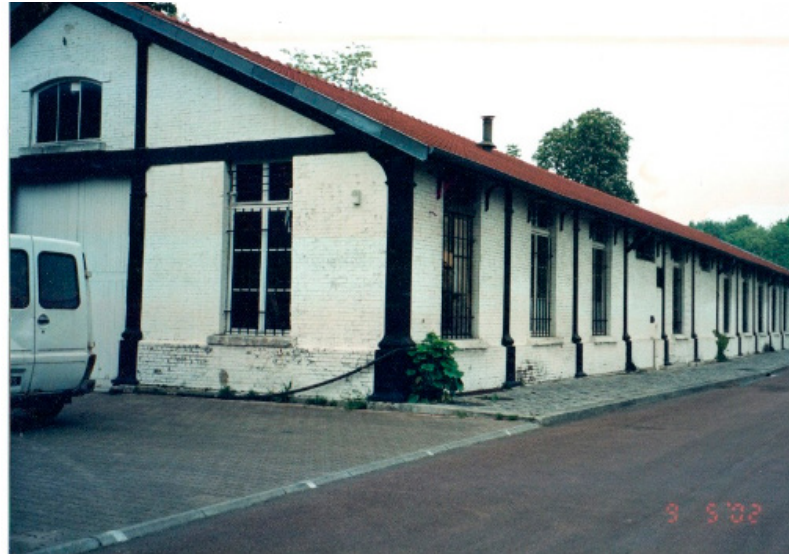
Figura 24: A lateral da parede dos “escritórios” marca o espetáculo que está em cartaz.