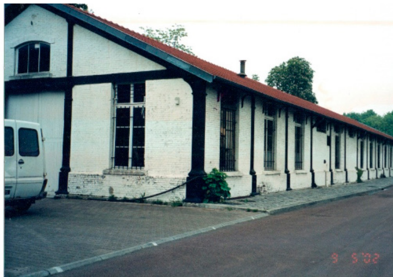
Figura 15: O barracão onde estão a sala de ensaio e a sala de costura.