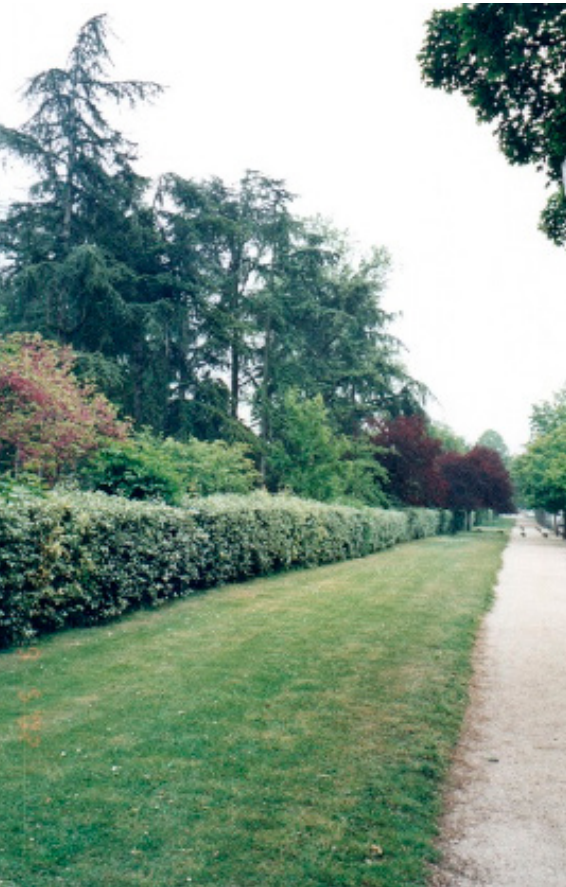
Figura 1: O caminho entre a descida do ônibus e a entrada da Cartoucherie.

Chegar ao Théâtre du Soleil já é por si só uma experiência única. O teatro fica localizado atrás do Jardim Botânico de Paris e do Parc Florale – o que dá uma ideia prévia dos aromas em torno do Soleil . Além da presença do Castelo de Vincennes nas cercanias.