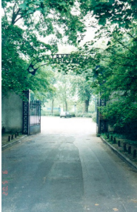
Figura 3: O portão de entrada na Cartoucherie.