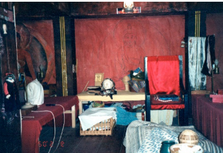
Figura 13:

parando para a performance. O canto da Juliana tem, entre outras coisas, uma máscara do rosto dela em gesso, para que possam ser costuradas ali as máscaras usadas em determinados espetáculos. Uma cadeira bem confortável, espelho, livros e outras coisinhas, entre elas um boneco de comédia dell'arte.