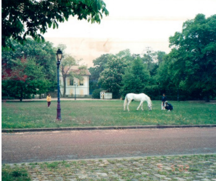
Figura 4: Dentro do parque em que está a Cartoucherie.