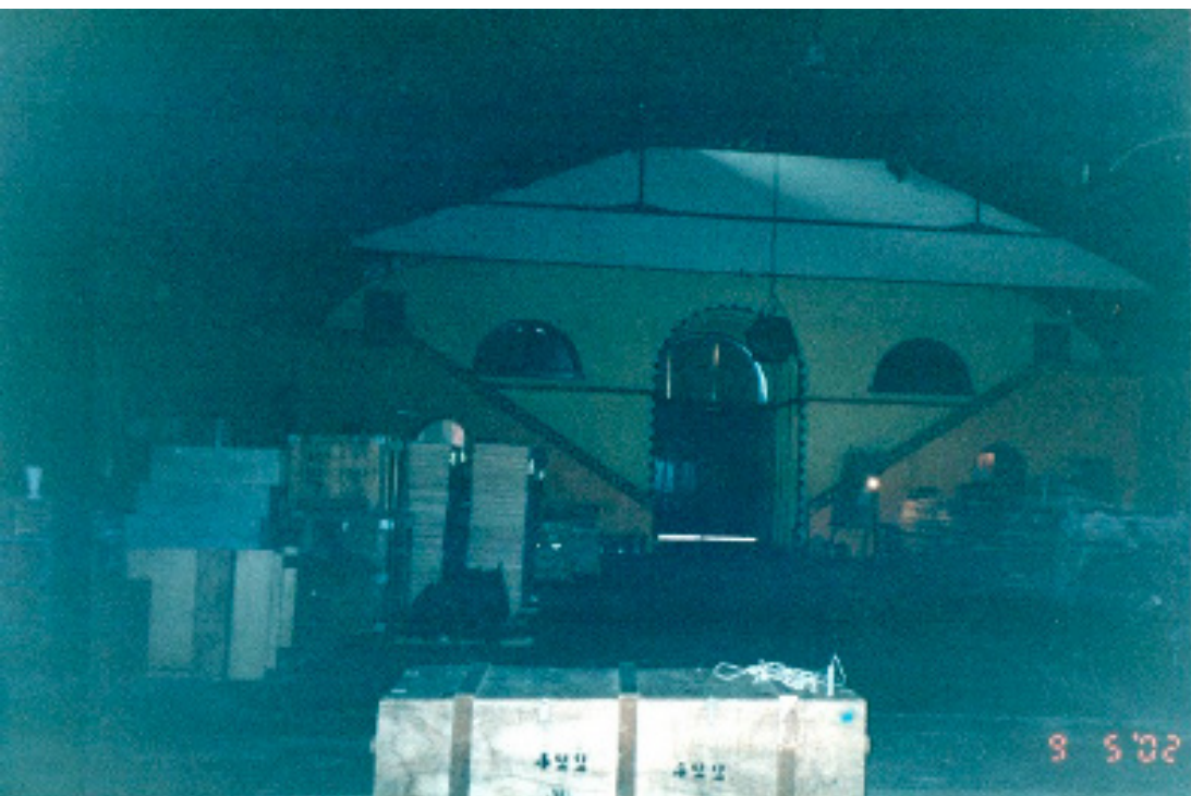
Figura 9: O hall do teatro.