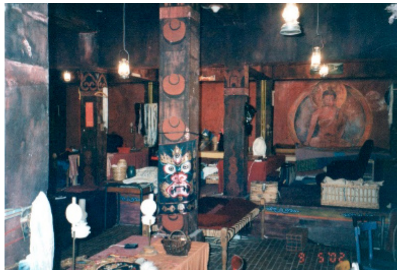
Figura 14:

Juliana passa a nos contar histórias sobre o Soleil , que ela viveu ou ouviu. Ela conta como foi o trabalho em Agamemnon , em que ela era “vomitada” em cena, resgatando os princípios de teatro grego. Seu coração batia acelerado, pois ela devia ficar sentada na cadeira, que era transportada por quatro atores até o palco e só deveria sair quando eles estivessem do lado do trono, com uma leve movimentação de quadris! E que ela pensava: “Meu Deus, por que eu escolhi esta profissão?”, antes de cada espetáculo, e depois de cada espetáculo: “Meu Deus, obrigada por eu ter escolhido esta profissão!”.