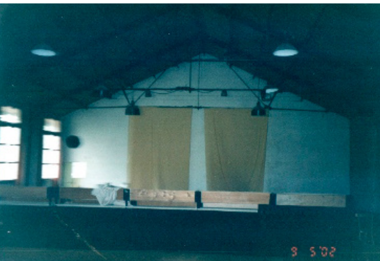
Figura 16: O palco da sala de ensaios.