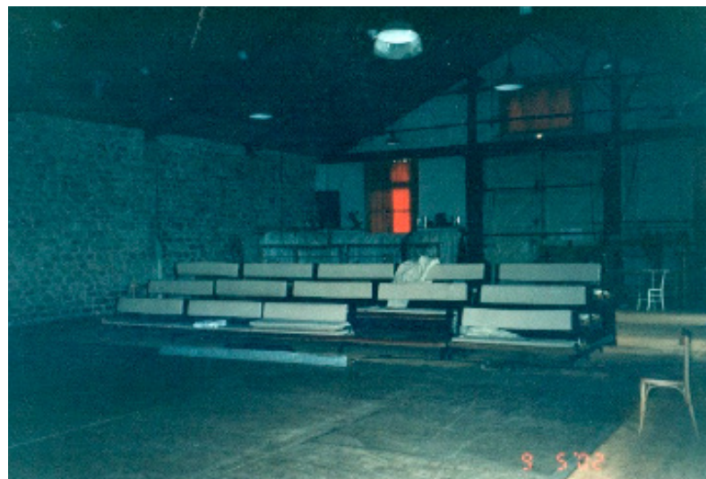
Figura 17: A plateia da sala de ensaios.