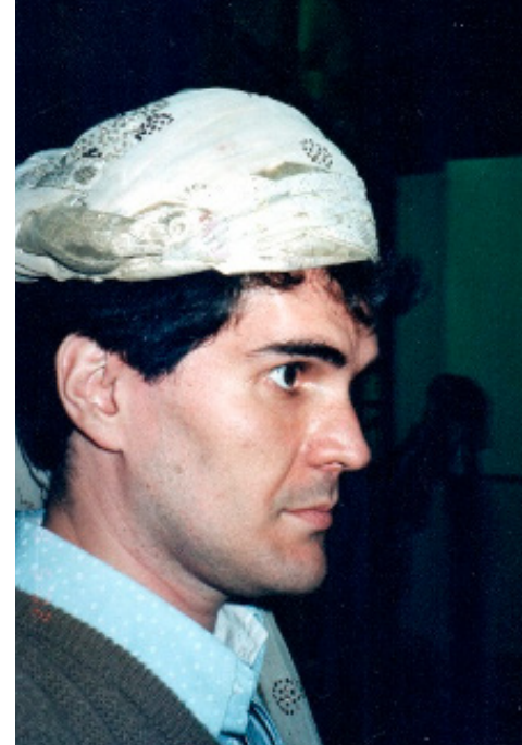
Figura 21: Uma selfie com o chapéu do Georges Bigot no ciclo do Shakespeare.