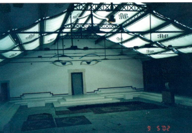
Figura 11: A grande sala.

Queria ver você ali. Um cheiro muito diferente, inebriante, instigante cobriu a sala. Diferente do cheiro de curry que senti nas oficinas. Correr e gritar era pouco – era preciso olhar, tocar, mexer, perguntar, morar ali!