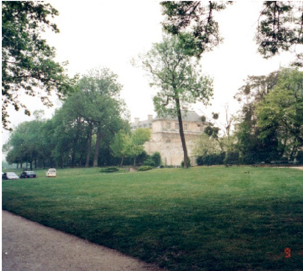
Figura 2: O castelo de Vincennes, no meio do caminho.