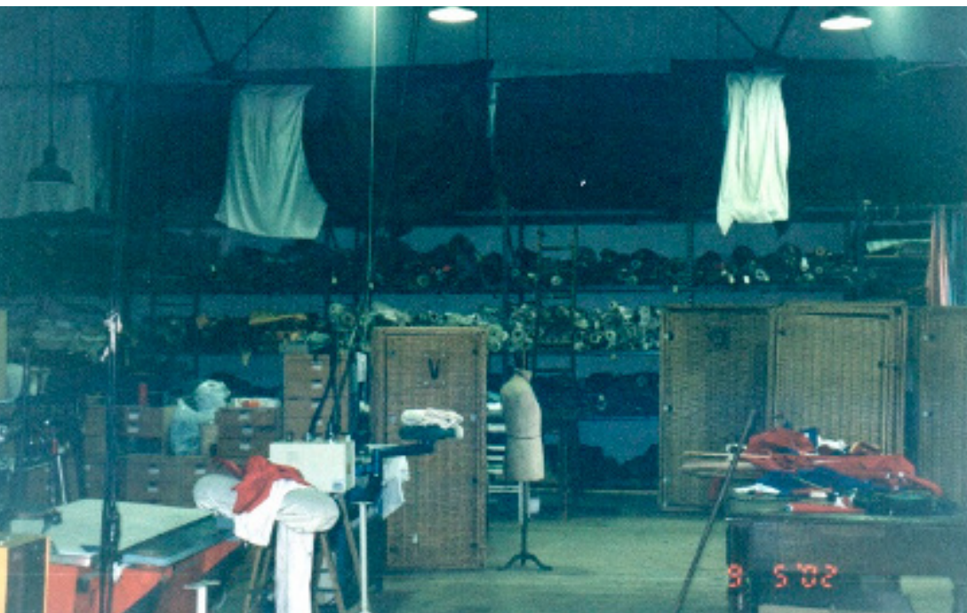
Figura 18: Visão geral da sala com os tecidos ao fundo.

A sala de figurinos é bastante espaçosa. E tem um aspecto um pouco bagunçado, embora não seja. Tem máquinas de costura, evidentemente, manequins de costureira e prateleiras com tecidos, linhas, arremates... No fundo da sala está uma prateleira alta, repleta de vários tipos de tecido, que vêm basicamente de um fornecedor de Lyon. São tecidos lindos, de todo tipo, caros, baratos, enfim, são tecidos que podem ser mexidos e tocados por qualquer ator que precise deles. Existe uma outra prateleira que guarda os tecidos muito caros, que só podem ser tocados por Nathalie Thomas, o carro-chefe das produções de figurino no Soleil . Um deles é um tecido asiático feito com fibra de abacaxi que custa US$ 450 – o metro.