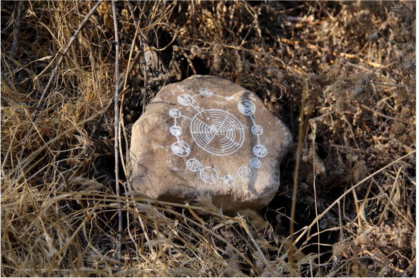
Glifo-poemas deixados para o futuro