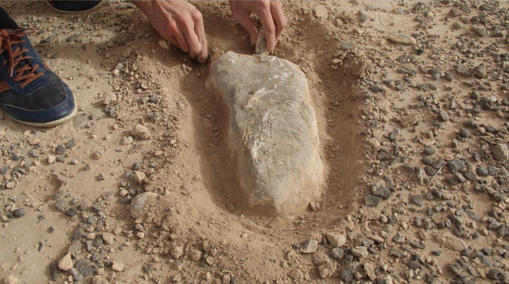
Pedras encontradas em territórios contestados