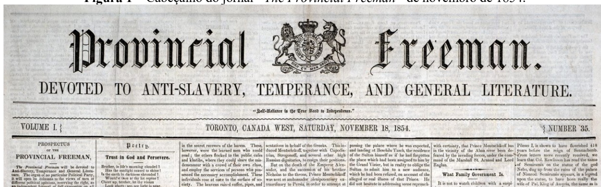
Figura 1 – Cabeçalho do jornal “ The Provincial Freeman ” de novembro de 1854.