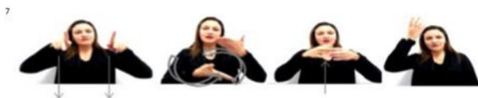
Imagem disponível em: < https://www.youtube.com/watch?v=xYqKmTH7kNA >

5 Serviço é um programa que interage com o sistema operacional de forma a produzir um resultado de acordo com o seu objetivo.