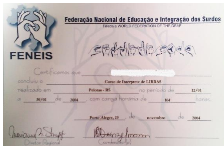
Figura 3 - Certificado da terceira formação para intérpretes promovida pela FENEIS/RS, na cidade de Pelotas/RS em 2004 – 104 horas.