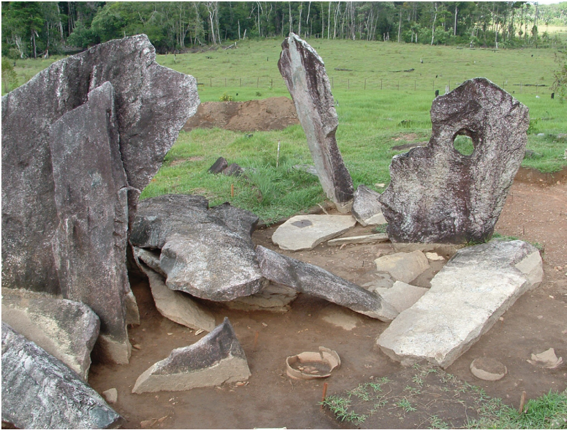
Figura 3 - Sítio megalítico do período EnferPolychrome

de blocos de granito em posições horizontal, vertical ou inclinada, dispostos no topo de colinas. Os tamanhos e as composições são variáveis. Algumas estruturas são pequenas, com menos de 10 metros de diâmetro, formadas por blocos medindo menos de um metro. Outras podem medir mais de 30 metros, sendo compostas por blocos de até 4 metros de altura.