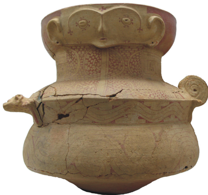
Figura 2 - Cerâmica antropomorfa típica do estilo EnferPolychrome

O tamanho pequeno dos sítios de aldeias e sua relativa invisibilidade no registro arqueológico já haviam sido notados por Meggers e Evans em 1957. De fato, as aldeias desse período nunca excedem 10.000 metros quadrados, possuindo estruturas muito simples, como concentrações de buracos de poste, pequenas fogueiras e lixeiras, o que indica uma curta permanência em cada lugar.