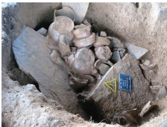
Figura 6 - Poço funerário no interior do sítio AP-CA-18, mostrando a intensa deposição de vasilhas/urnas

Quatro dessas estruturas foram objeto de investigações arqueológicas. Essas investigações mostraram que as diferenças em tamanho das estruturas refletem diferenças nas deposições de objetos e, portanto, dos mortos. As menores estruturas megalíticas possuíam deposições mais simples em poços funerários, como urnas lisas e, em alguns casos, o sepultamento direto de ossos humanos em uma câmara lateral. A maior estrutura, no entanto, era formada por um intenso palimpsesto de diferentes tipos de deposições. As performances envolvidas nessas deposições não se limitaram à colocação das peças dentro dos poços, havendo casos de reabertura e manipulação de seu conteúdo.