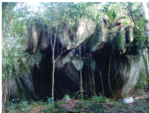
Figura 7 - Abrigo rochoso com cerâmica Aristé

Como no caso das estruturas megalíticas, também esses lugares naturais atestam uma prolongada relação com os grupos indígenas que os utilizavam, indicando que as práticas de visitas e revisitas perduraram por um longo período e por uma extensa área. Dada a semelhança entre a composição dos objetos presentes, seus conteúdos e sua forma de manipulação, as cavernas são verdadeiros “megalitos naturais”. Não são monumentos, no sentido estrito do termo, mas sim lugares na paisagem monumentalizados pela prática. Apesar das claras diferenças estruturais entre os dois tipos de sítios (um presente na natureza, outro construído), o que observamos é a repetição de performances, resultando em registros arqueológicos bastante similares, o que reforça uma complementaridade entre esferas que – dentro do pensamento moderno ocidental – são consideradas opostas: natureza e cultura.