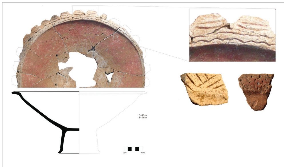
Figura 1 - Cerâmicas típicas do estilo OuanaryEncoché

A sequência de ocupação Aristé começa com o estilo Ouanary Encoché , caracterizado pela presença de apliques zoomorfos, modificações incisas e ponteadas, principalmente localizadas nas bordas das vasilhas, além de tempero de quartzo na cerâmica. Datado do início da era cristã, esse estilo irá durar até o século X.