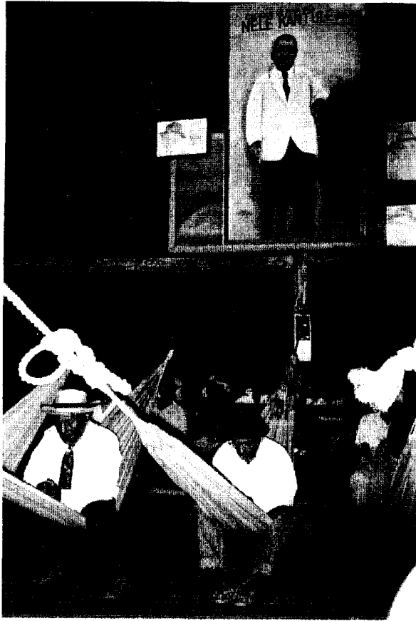
FOTO 4. LOS SAILAS EN UNA SESION DE LA CASA DEL CONGRESO USTUPU, 1997.