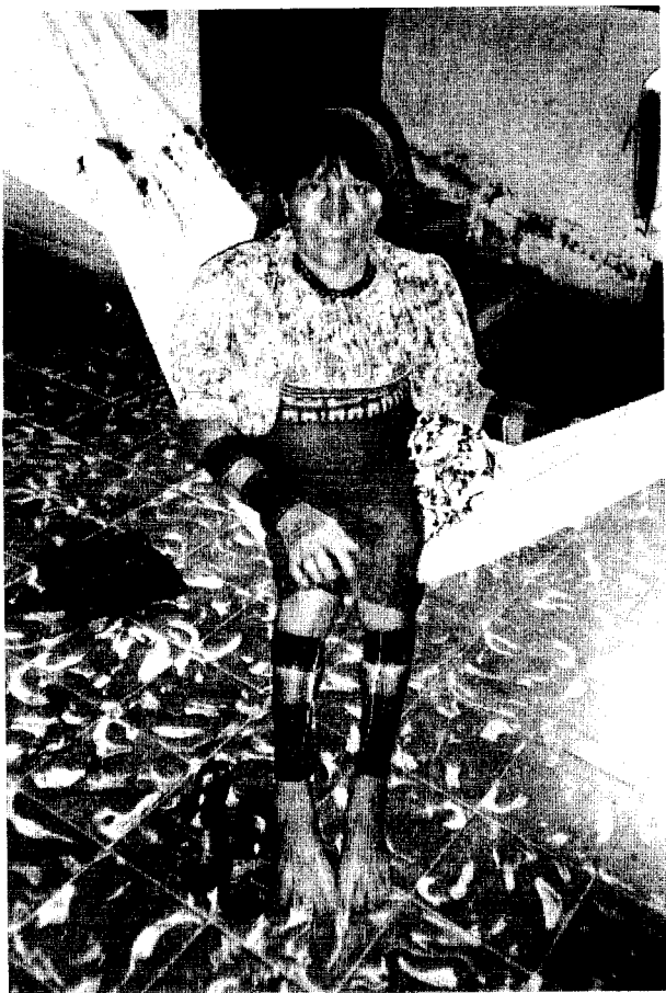
FOTO 2. INDUMENTARIA ACTUAL DE LA MUJER KUNA 1997