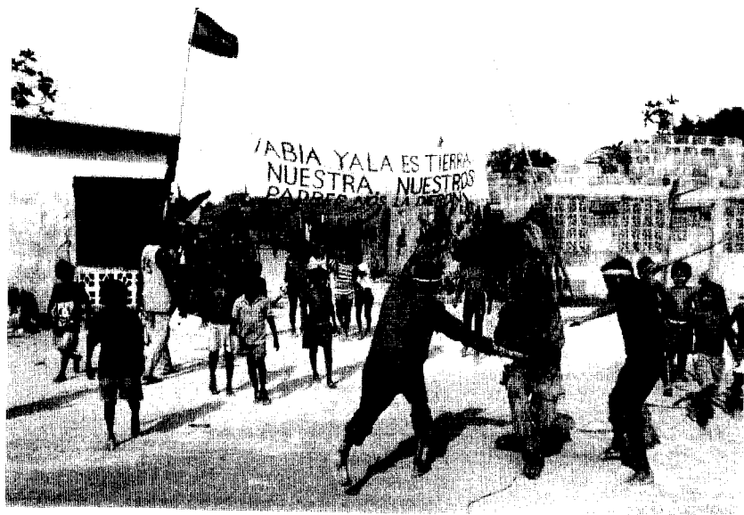
FOTO 3. DRAMATIZACION PUBLICA DE LA BATALLA CONTRA LA POLICIA COLONIAL PANAMEÑA EM 1925. 1977