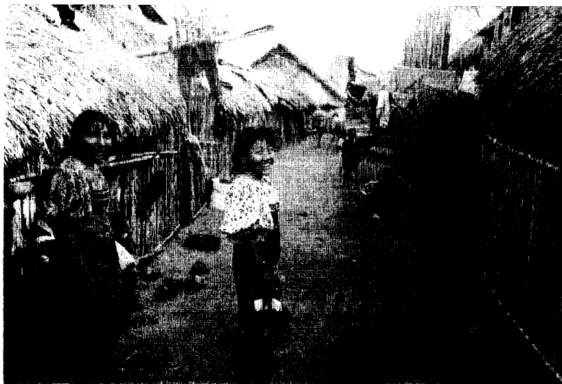
FOTO I. JOVENES KUNA EN LA ISLA DE USTUPU, 1997.