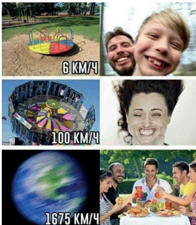
Figura 1: Imagem publicada em um grupo terraplanista em um aplicativo de mensagens instantâneas.

sugere a impossibilidade de a Terra girar a uma velocidade de 1675 km/h e, assim mesmo, ser possível sentar-se em uma mesa e comer as nossas refeições sem que elas voem.