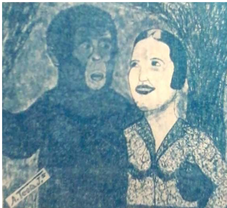
Fig. 5 - Ilustração de capa da novela O filho do gorila , de Pinto Guimarães (1937) Biblioteca Nacional de Portugal

Outra mulher grávida de um gorila aparece no primeiro episódio de Animal City , do desenhista nigeriano Olufemi Olaide K. Arowolo (2002). A história dessa banda desenhada faz eco a uma tradição oral africana. Uma jovem encontra um gorila na floresta. O marido vem a seu socorro, mas ele é morto pelo gorila. Na verdade, trata-se de um gorila “possuído” ( the evil forest ), raptor e homicida 48 . Meses depois, a jovem Maya dará luz a gêmeos. Um deles é um gorila 49 .