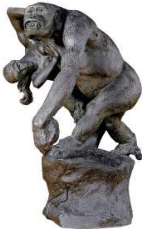
Fig. 2 - Gorille enlevant une femme (1887) Emmanuel Frémiet Musée des Beaux-Arts de Nantes

No último quartel do século XIX, o número de matérias ilustradas sobre os gorilas aumentou na imprensa periódica. Em 1878, o Journal des Voyages publicou em sua primeira página uma cena de um gorila a atacar três homens africanos, enquanto um outro gorila leva sobre o seu ombro uma jovem 26 . Em 1885, o mesmo periódico reproduziu o segundo capítulo de um romance de Louis-Henri Broussenard, no qual uma jovem foi raptada por um gorila. Uma ilustração da cena apareceu na primeira página do semanário francês 27 . Anos depois, outra matéria do mesmo periódico abordava uma expedição no país dos gorilas 28 . Em 1909, o Journal de Voyages publicou uma outra história de rapto de uma mulher por um gorila e com ilustração na primeira página 29 . Esses exemplos da imprensa metropolitana demonstram a inscrição das representações do gorila como raptor de mulheres no imaginário ocidental.