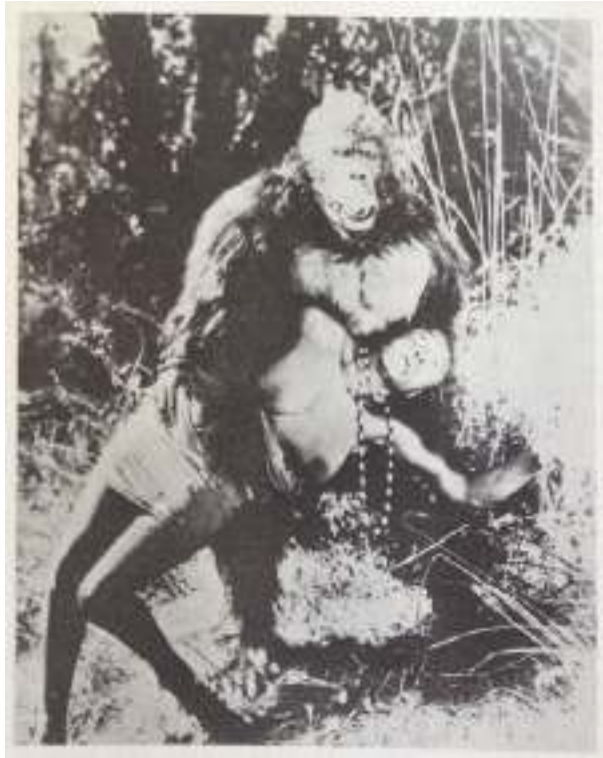
Fig. 4 - Ingagi (1930)

Em 1933, houve a estreia de King Kong no cinema, cujo cartaz remete à figura icônica do rapto da escultura de Frémiet. Desde então, a fantasia em torno do gorila que sequestra mulheres se tornou uma constante no cinema. A propósito, o rapto de Jane em Tarzan The Ape Man (1932) remete ao mesmo imaginário social. Em 1950, gorilas que atacam mulheres aparecem no terceiro filme da série Jungle Jim . Em 1958, o filme Bride of the Gorilla chegou às telas do cinema. Nesses filmes, percebe-se a ambivalência da representação de raça, gênero e monstrosidades em contexto colonial na indústria cinematográfica (Berenstein, 1994).