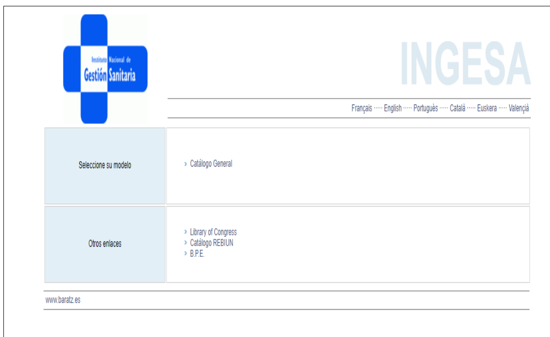
Figura 2 – Catálogo de la Biblioteca del INGESA.