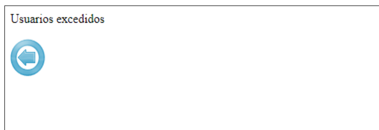
Figura 7 - Aviso de que no es posible acceder al catálogo.