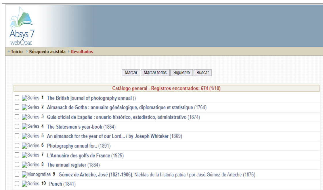
Figura 6 - Catálogo de la Biblioteca del INGESA. Relación de documentos de la Biblioteca Camilo Hurtado de Amézaga.

Como en el caso anterior, las colecciones se tratarán como un dato bibliográfico único, pero haciendo constar en la descripción que contiene varios volúmenes.