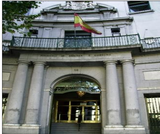
Figura 8 - En la actualidad, entrada principal del Instituto Nacional de Gestión Sanitaria (INGESA), por la calle Alcalá nº 56.

Respecto a las colecciones, la del duque de Bailén recoge obras en español, francés, inglés, italiano, latín y ruso, en ese orden. Y por materias, los grandes grupos son Arte (sobre diferentes estilos y monumentos), Lengua y Literatura (con obras en varios idiomas, diferentes géneros literarios, historia y crítica), Religión, Medicina, Historia (de diferentes países y civilizaciones), España (con obras sobre: Costumbrismo, Diplomacia, Industria, Política, Economía, Sociedad...), Derecho, Religión, Matemáticas, Medicina, Ciencias, Diccionarios y Enciclopedias y Varios (con obras sobre Animales, Cartomancia, Emisoras de radio, Estadística, Exposiciones, Automovilismo, Fotografía, Heráldica...)