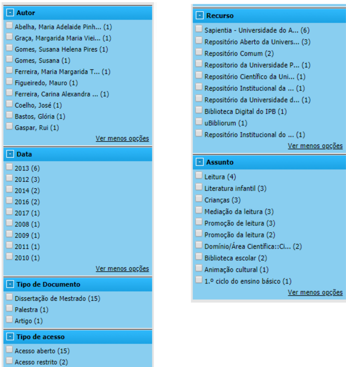
Figuras 2 e 3 - Categorias da pesquisa 1